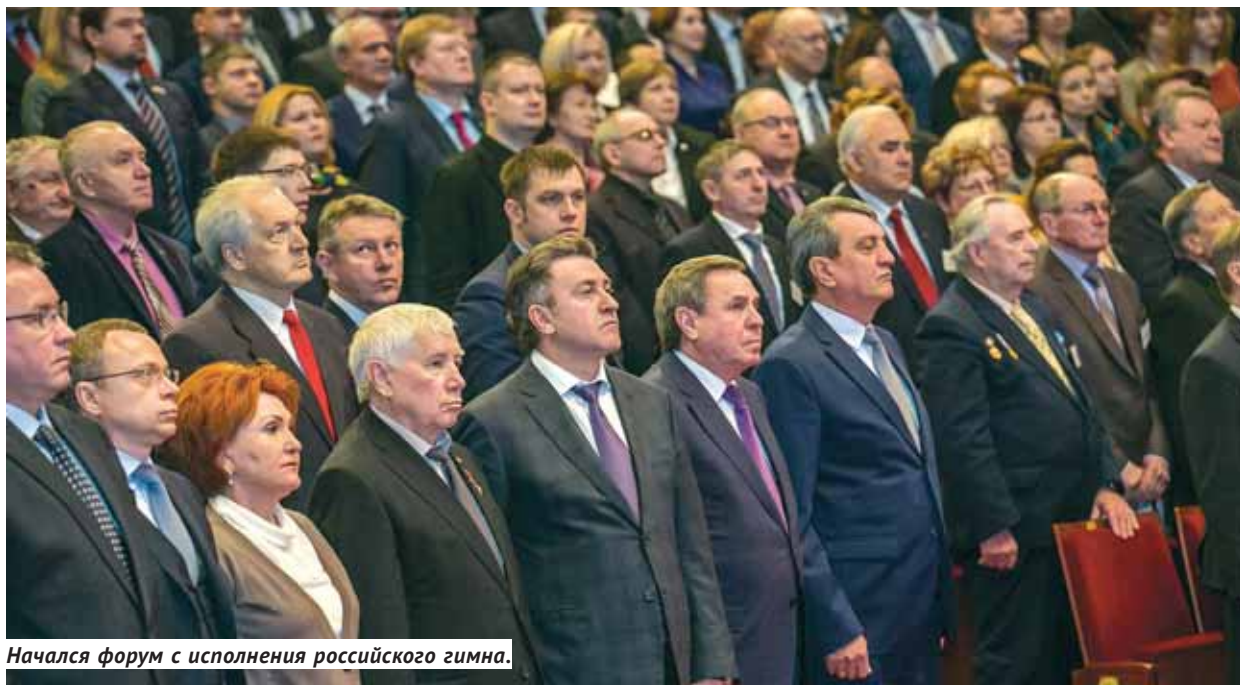
Начался форум с исполнения российского гимна.

Подведение итогов 2016 года и определение приоритетных задач на 2017-й — таковы основные вопросы повестки дня этого традиционного ежегодного мероприятия. В зале собрались руководители органов власти, депутаты всех уровней, главы муниципальных образований, представители общественных организаций.