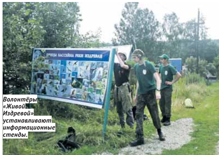
Волонтеры «Живой Издревой» устанавливают информационные стенды.

положен в бассейне реки Издревой, что несёт потенциальную угрозу для её экосистемы и местных жителей, утверждает инициативная группа «Поможем реке Издревая». Уже в августе 2016 года группа начала сбор подписей под обращением к губернатору с просьбой перенести полигон на участок, более удалённый от населённых пунктов, дачных сообществ, зон отдыха и ценных природных территорий. За месяц было собрано более 3500 «бумажных» подписей и более 1 000 электронных. Девять докторов и кандидатов биологических наук направили в прави-