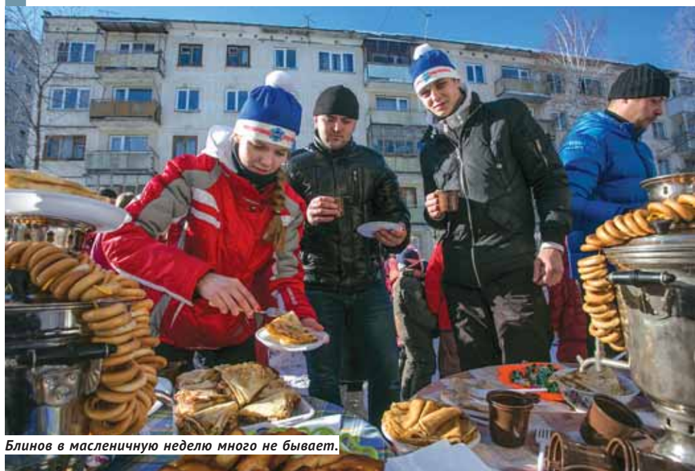
Блинов в масленичную неделю много не бывает.