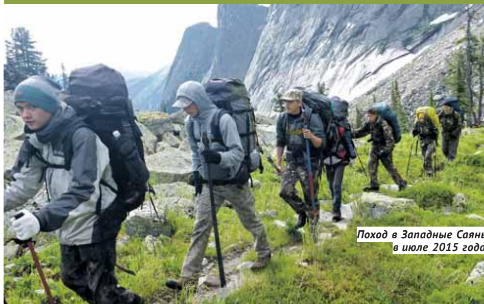
Поход в Западные Саяны в июле 2015 года.

Более 5 200 воспитанников Дома детского творчества имени Володи Дубинина строят модели и танцуют, занимаются археологией и ходят в лыжные походы, гоняют на картах, проектируют роботов и устраивают фотовыставки.