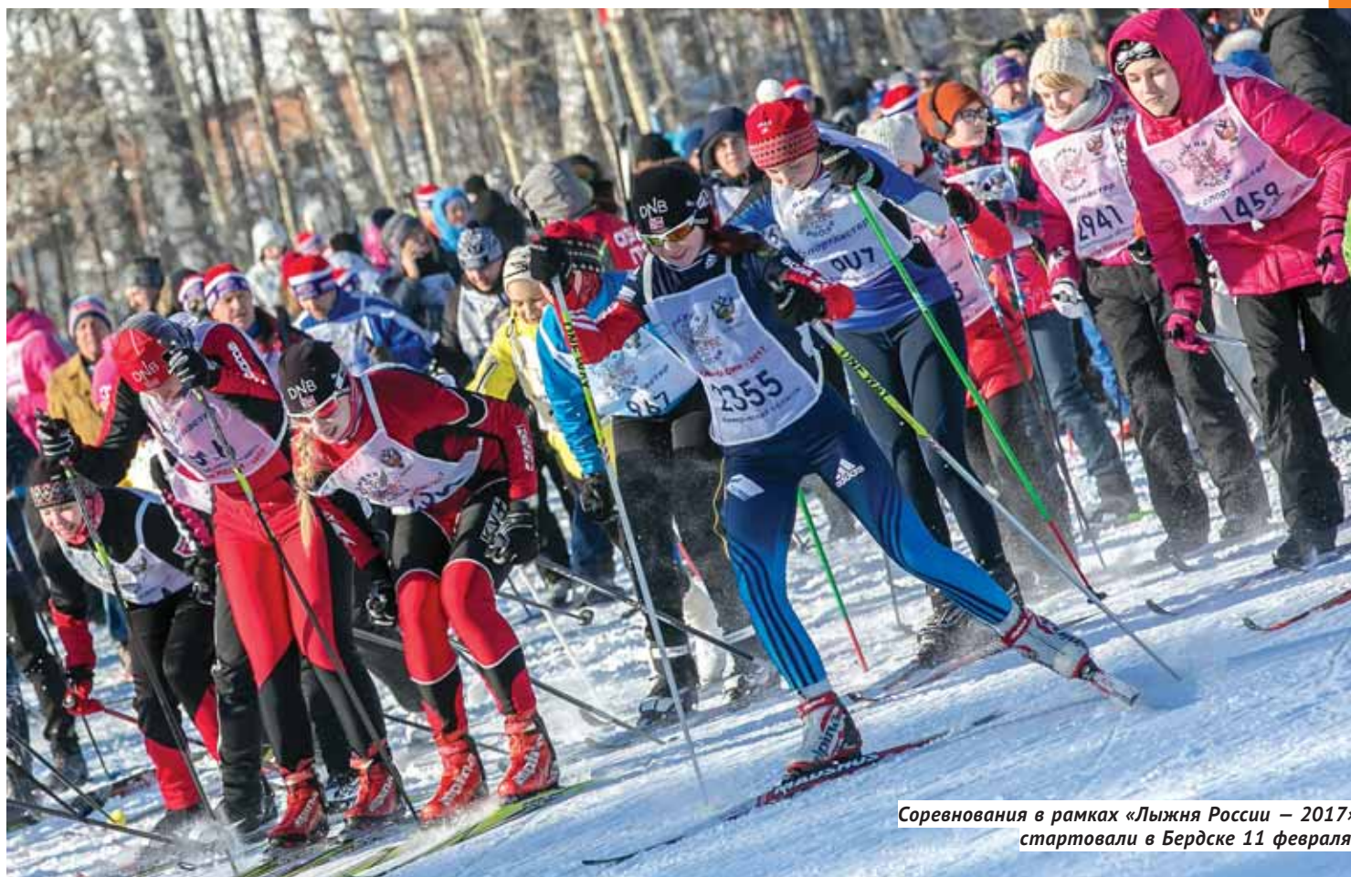
Соревнования в рамках «Лыжня России — 2017» стартовали в Бердске 11 февраля.

Минувшая суббота стала самым спортивным днём года.